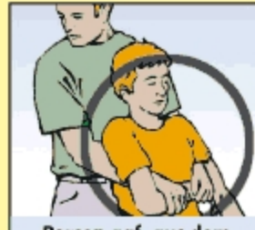
Person ggf. aus dem Gefahrbereich retten